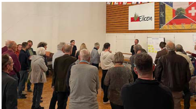
Anwesende an der Wand zum Thema Drehscheiben.

Es wurden diverse Kommentare zu den drei Diskussthemen genannt. Die Anwesenden wünschen sich klare Regeln insbesondere in Bezug auf die nachhaltige bauliche Entwicklung, die Aussenräume, Verkehr und die Klärung des späteren Betriebs. Die Rückmeldungen sprechen sich in einigen Bereichen für strengere bzw. erweiterte Regeln, als nun vorgestellt, aus. Zwei anwesende Grundeigentümer begrüssen einen stärkeren Einbezug